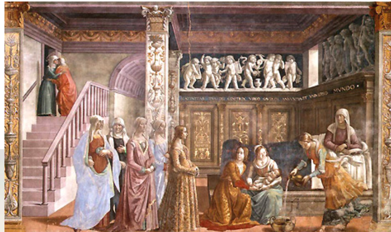
Santa Maria Novella, les fresques de Ghirlandaio (chœur).