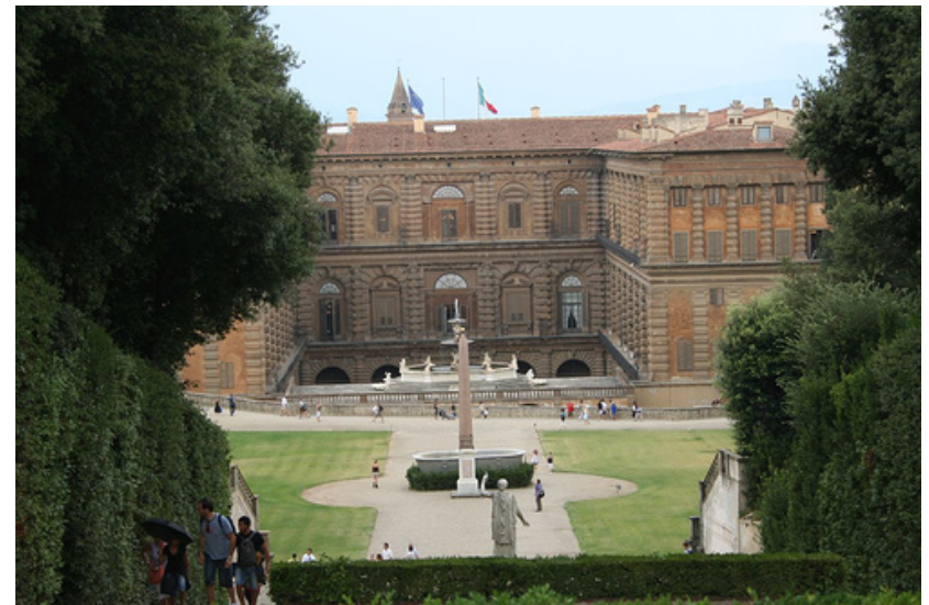
Palais Pitti et les jardins Boboli.