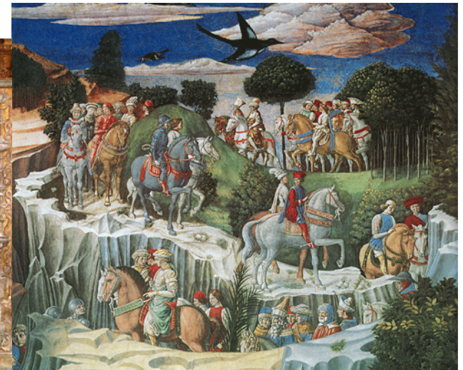
Gozzoli, La chapelle des Mages, palais Médici-Riccardi.